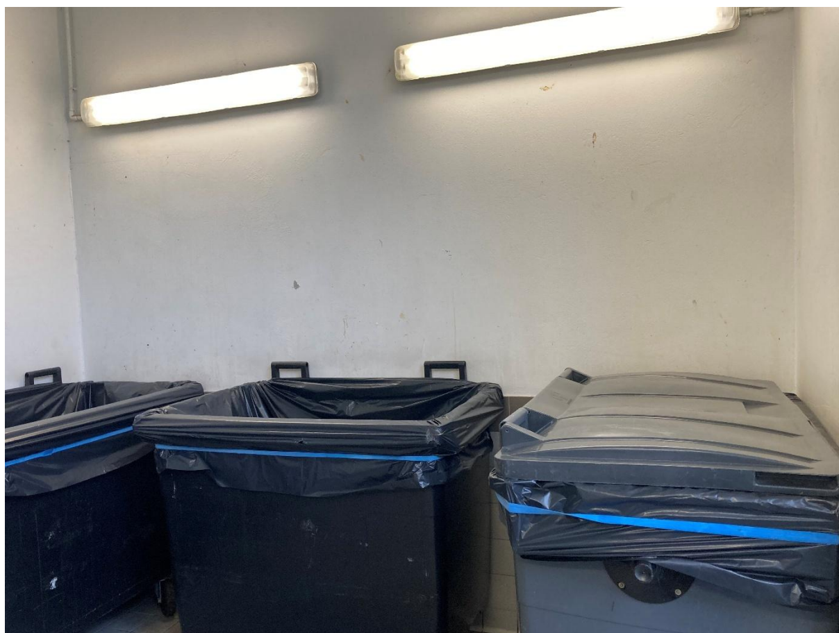
Local n°3 – vue depuis l'entrée