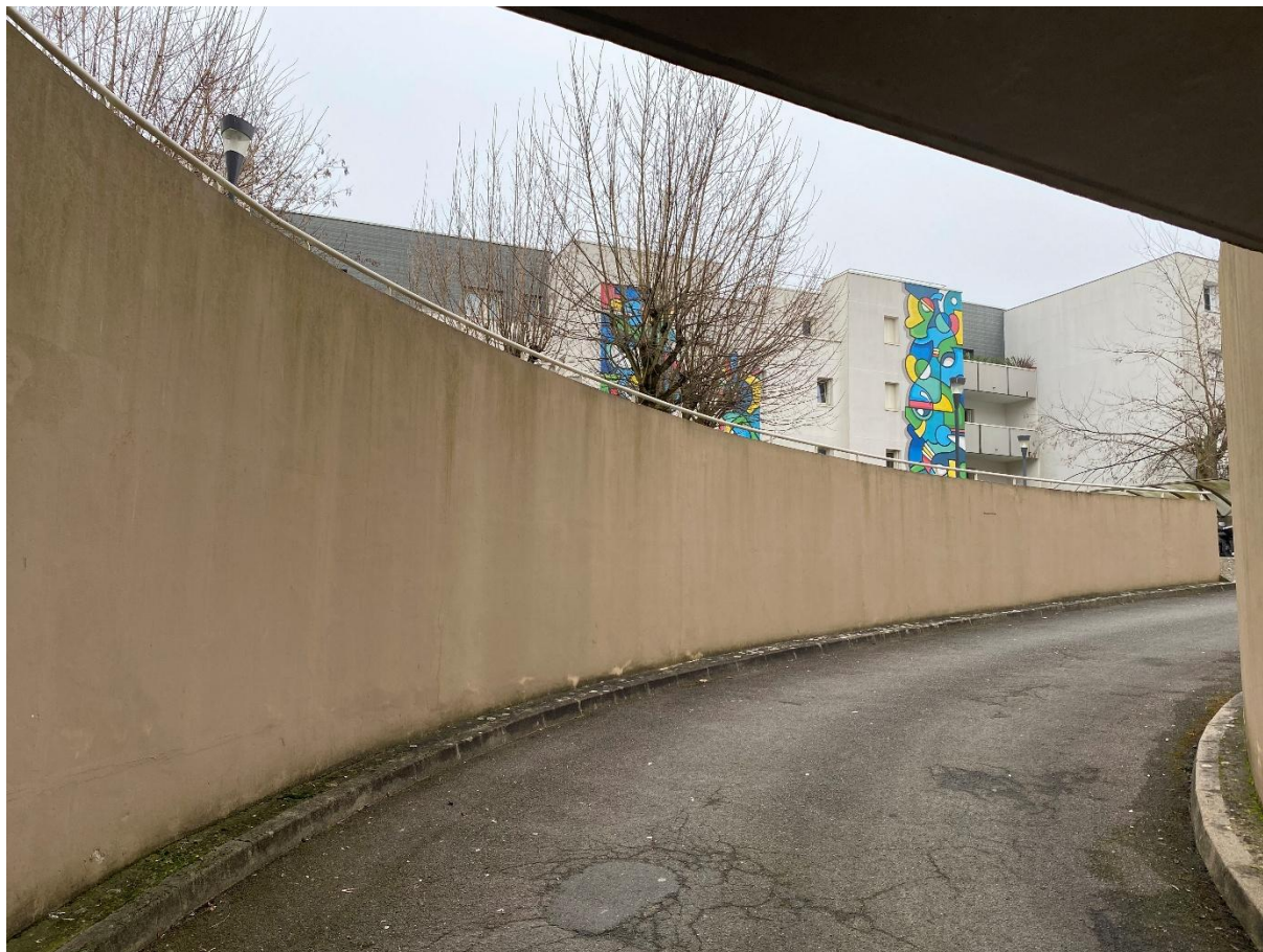
Evry- Entrée du parking souterrain vue du portail