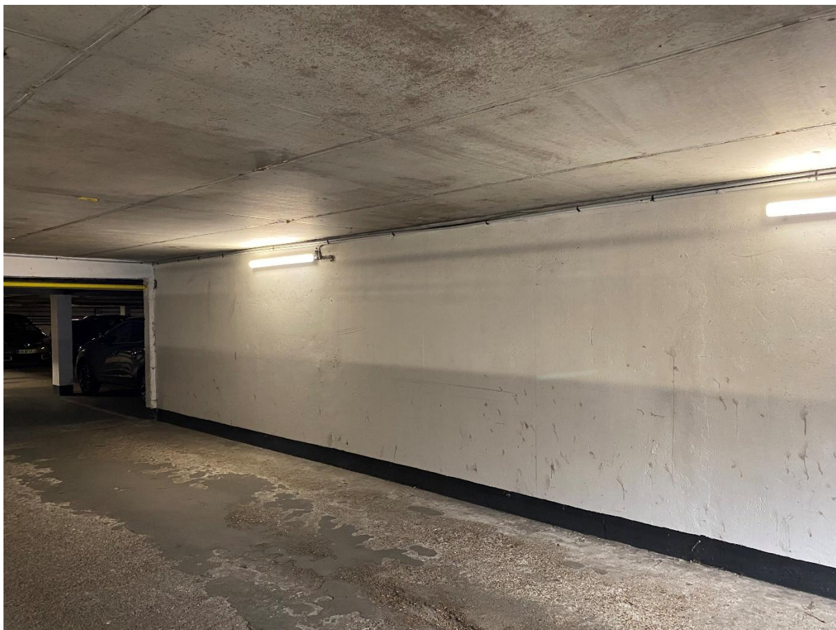
Vue d'ensemble du support de la fresque