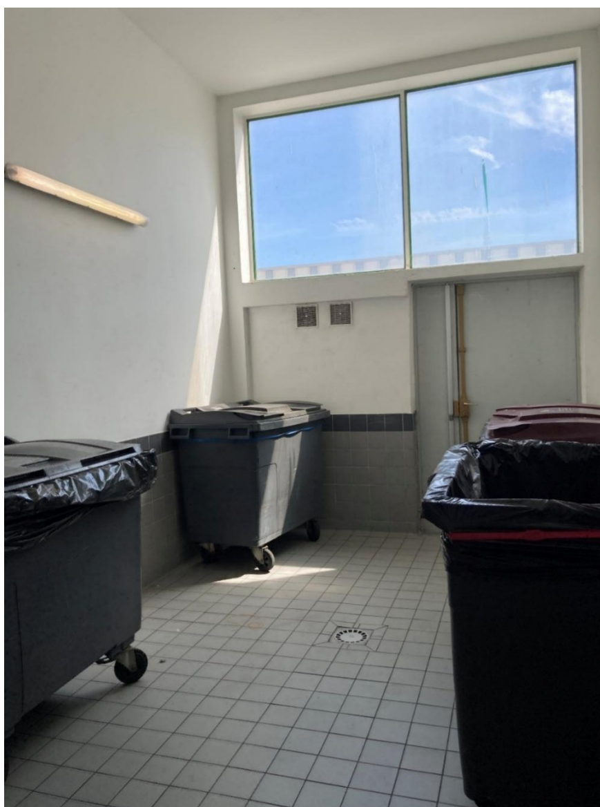
Local n°1 – vue depuis l'entrée