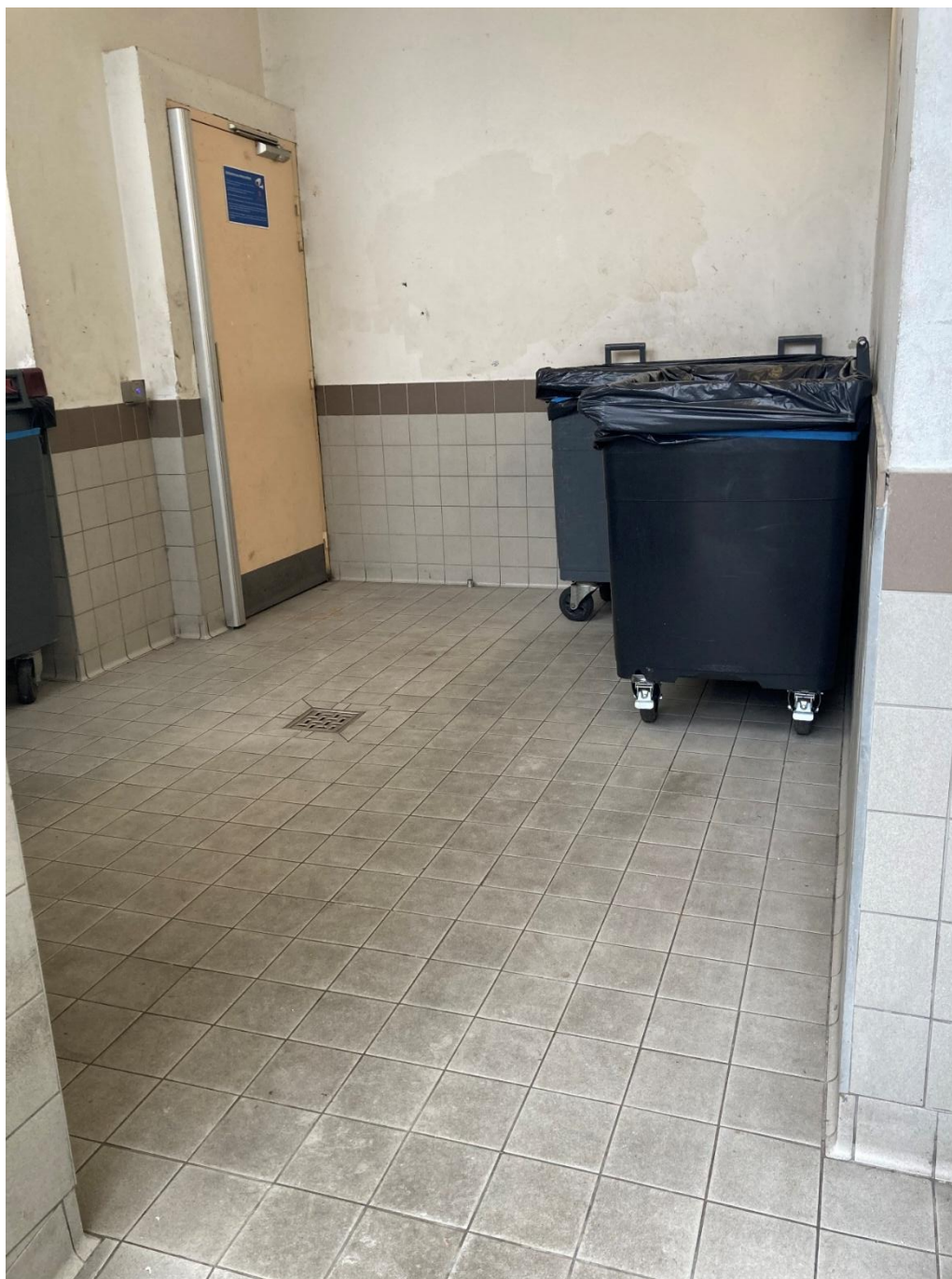
Local n°2 – vue depuis l'entrée