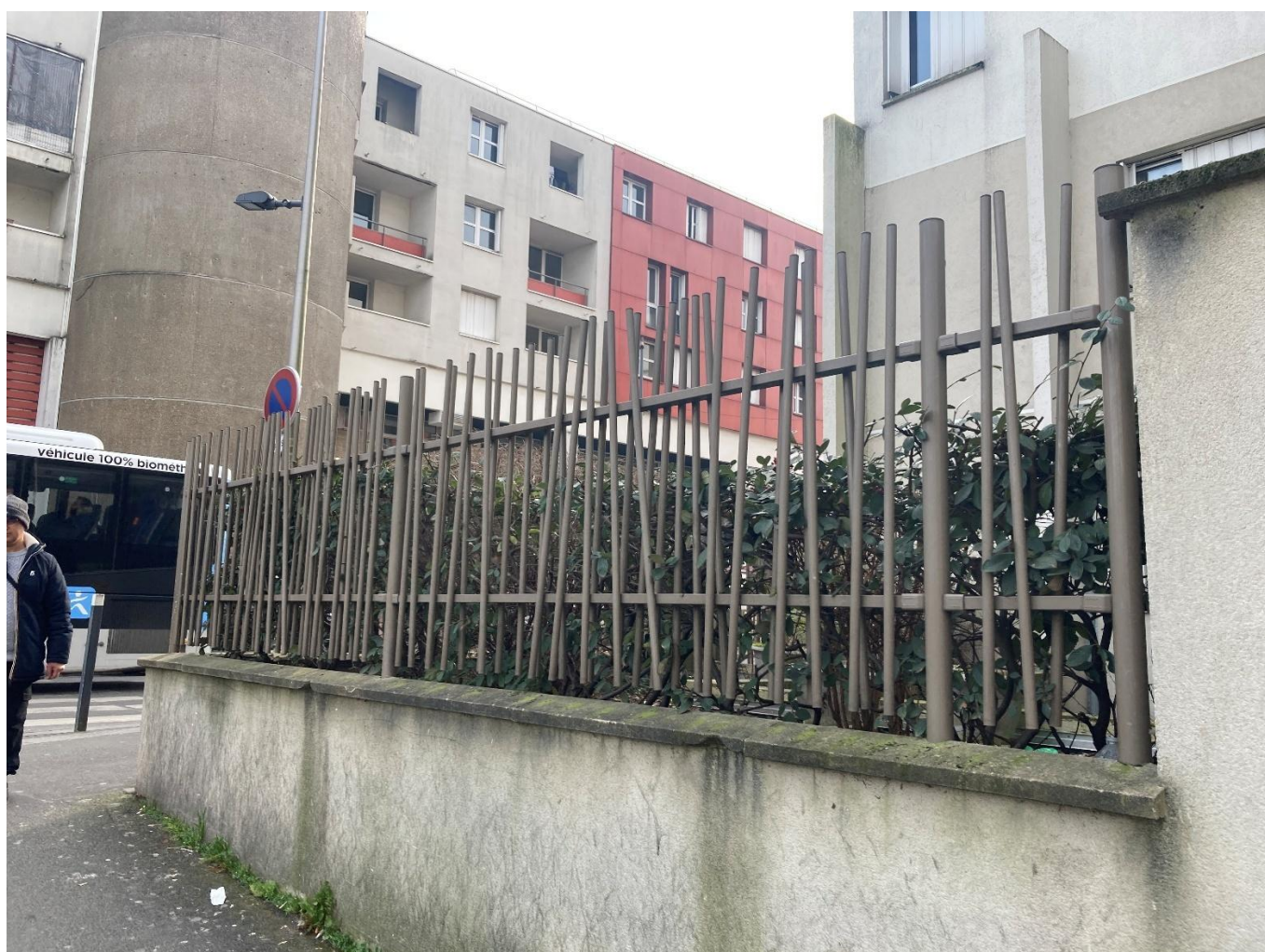
ENVIRON 6 METRES DE LONG