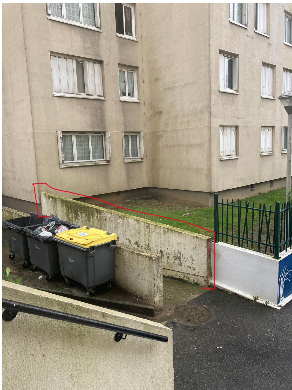
Descente du local encombrants - 7 mètres