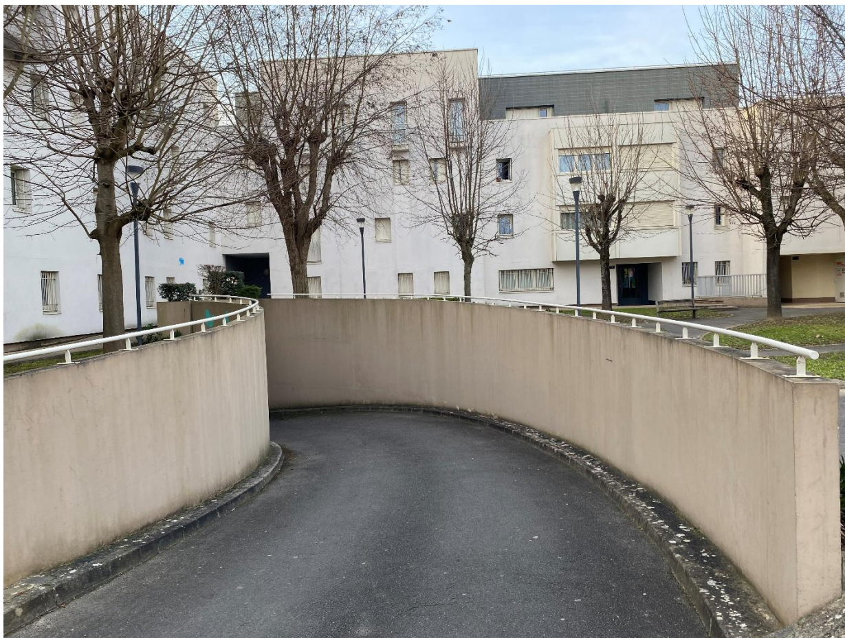
Evry - Entrée du parking souterrain