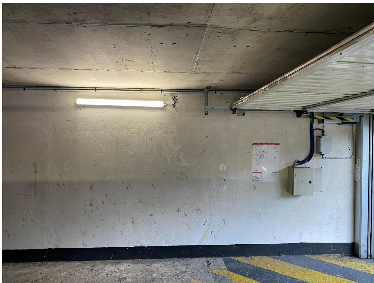
Entrée du parking souterrain avec portail - Support mural de la fresque