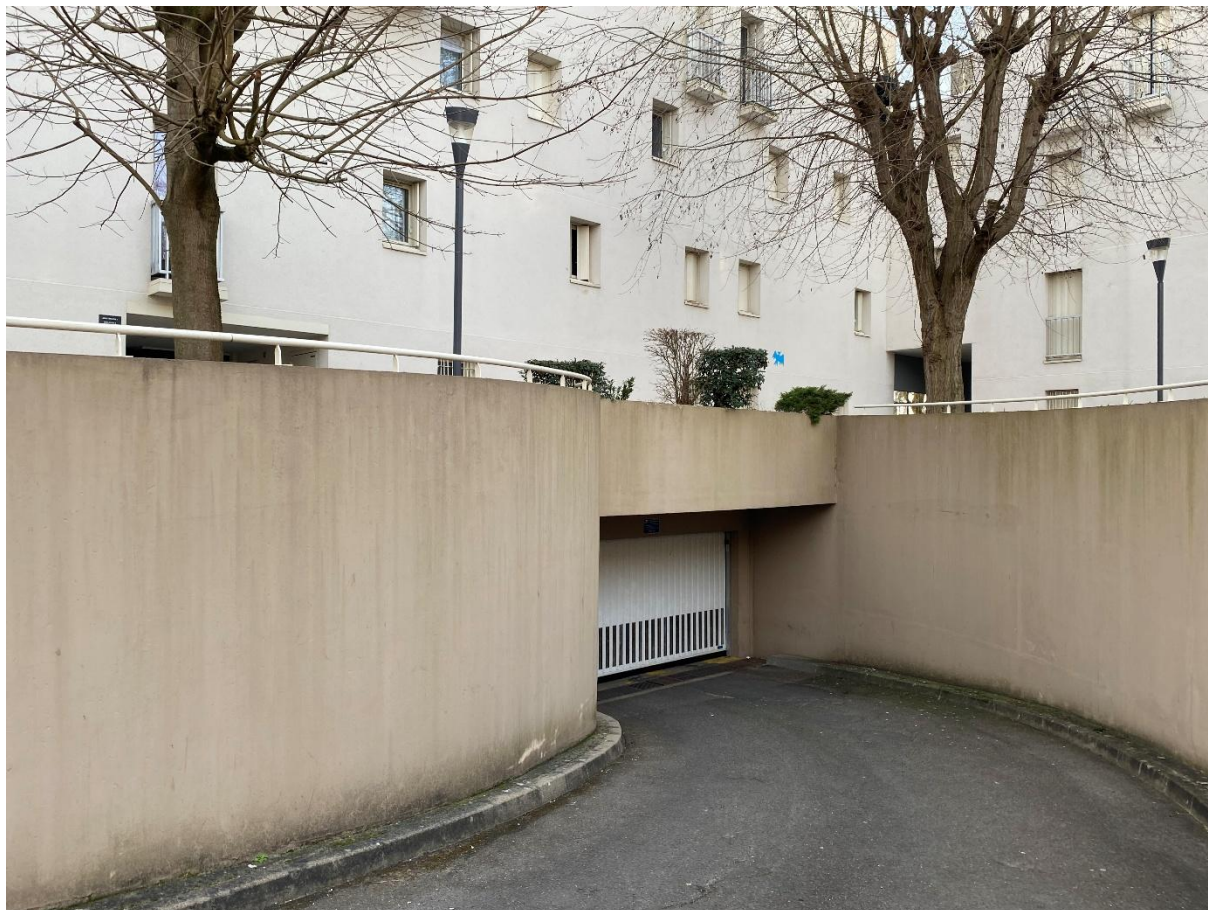
Evry - Entrée du parking souterrain vue rapprochée du portail automatique