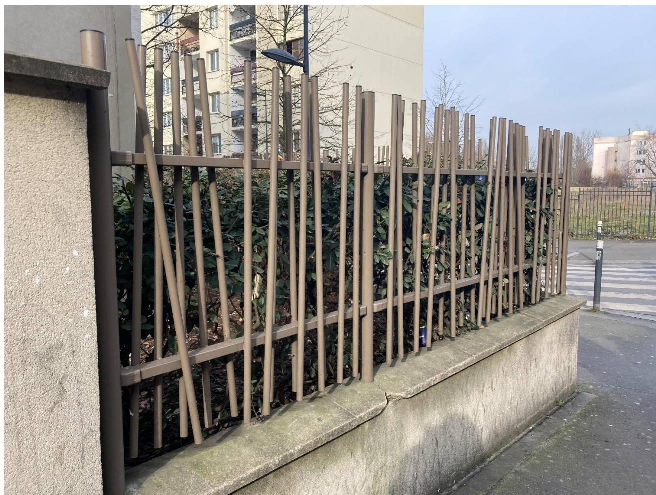
ENVIRON 3.5 METRES DE LONG