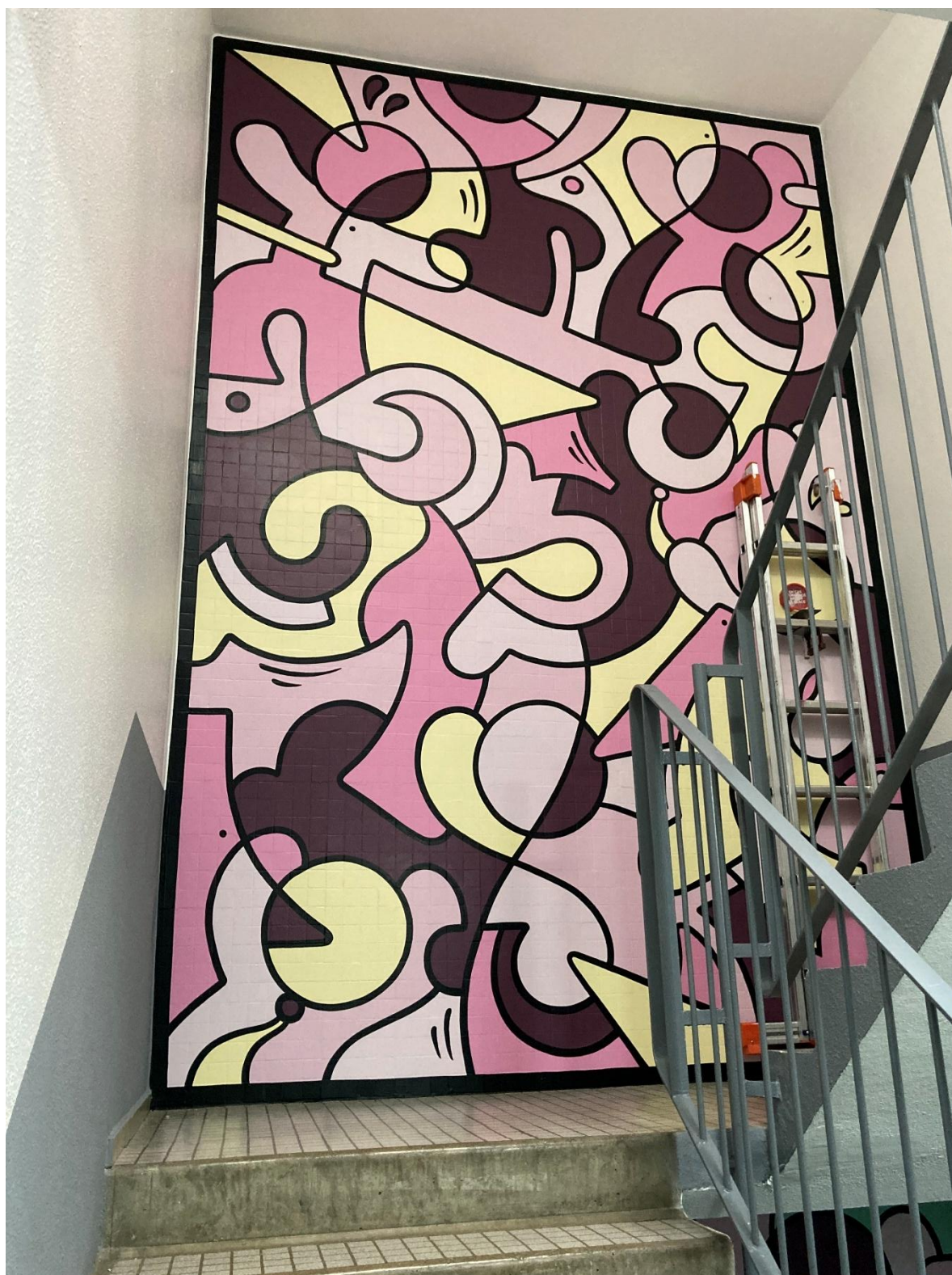
Après (fresque réalisée en 2023 sur une cage d'escalier similaire au 3 et 5 rue d'Alger)