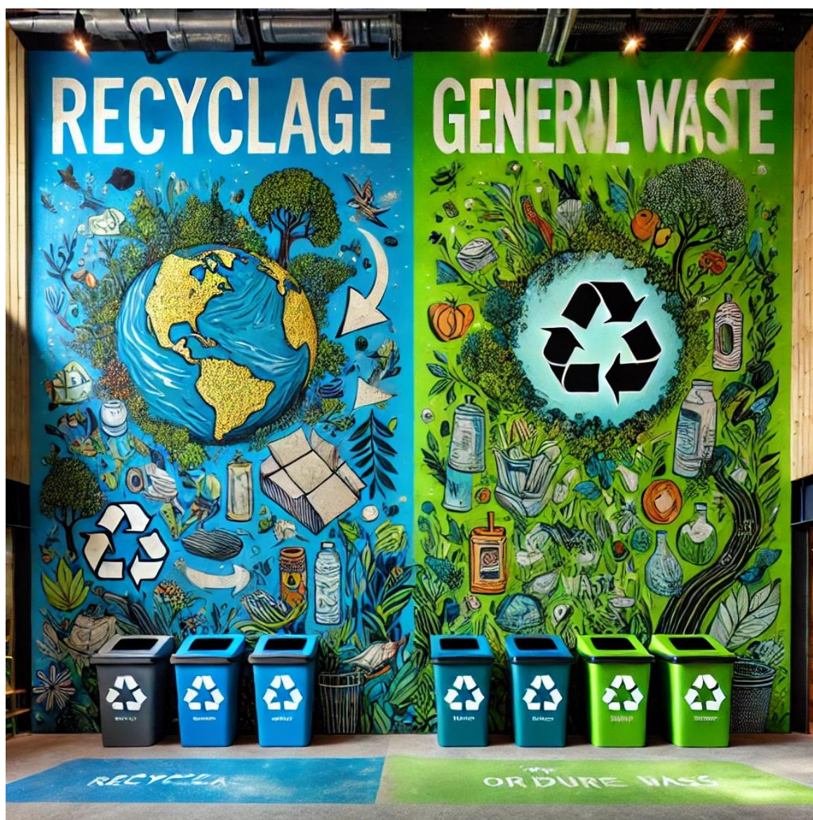
Exemple de fresque « incitative » aux gestes de tri – projection réalisée par une intelligence artificielle